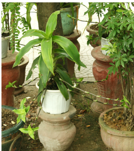
Cây dâm vòi

Lược vàng là loài cây thân thảo đa niên, thân ngắn, tích trữ nhiều nước, thích nghi theo hướng chịu hạn, có nhiều cầu sinh dưỡng, gọi theo kiểu dân giả là vòi. Lá màu xanh lục sáng, hình ngọn giáo, dài 8-12cm, rộng 4-5cm, mép hơi gợn sóng, mọc xoắn ốc, tạo thành cái loa hình hoa thị trông tựa một cái phễu ở đỉnh. Lá có thể thay đổi một ít hình dạng và màu sắc khi ở các môi trường khác nhau. Trong điều kiện chiếu sáng toàn phần, cường độ ánh sáng mạnh, ẩm độ không khí và ẩm độ đất thấp thì lá ngắn lại, mép gợn