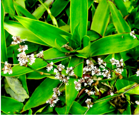
Callisia fragrans (Lindl.) Wood.

Gần đây có quá nhiều thông tin về công dụng chữa bệnh của một loài cây mang tên “Lược vàng”. Các thông tin này thuận nghịch nhiều chiều khiến người đọc không biết tin vào đâu. Một số thông tin dè dặt, nhưng cũng lắm thông tin cho rằng Lược vàng là một loại “thần dược”, trị được bá bệnh, kể cả những bệnh hiểm nghèo như ung thư! Một số lương y và một số phóng viên đã dựa vào thông tin truyền miệng của cộng đồng ở Thanh Hóa để cho rằng Lược vàng trị được hàng loạt bệnh như các chứng bệnh tim mạch, tăng huyết áp, thoái hóa